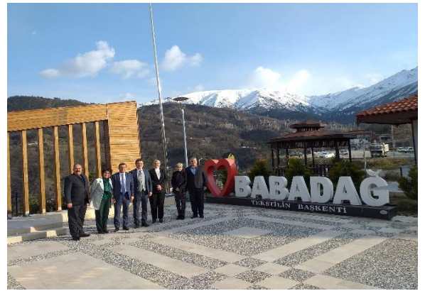
Babadağ/DENİZLİ - 22/03/2022