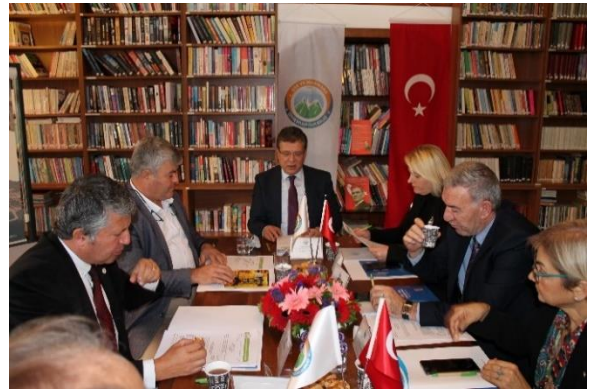
Küçükkuş / ÇANAKKALE- 27/10/2021