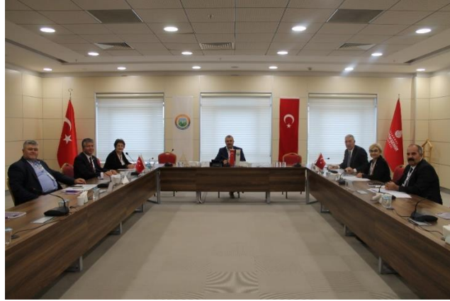
İSTANBUL - 01/10/2021