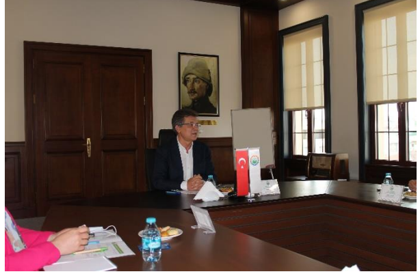
Büyükçekmece /İSTANBUL - 25/06/2021