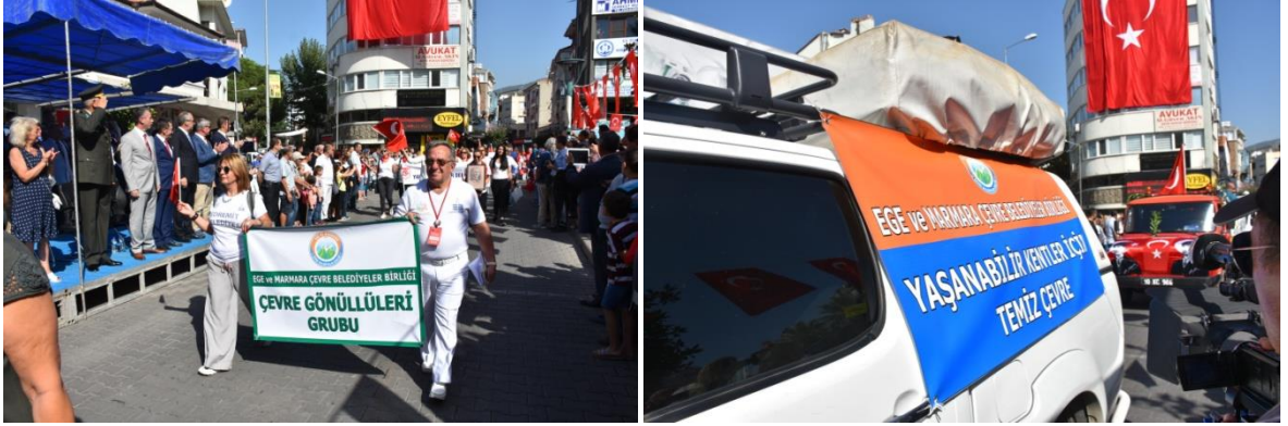
Edremit Kurtuluş Etkinlikleri

Edremit'in düşman işgalinden kurtuluşunun 95.yıl dönümü etkinlikleri kapsamında Edremit Belediyemiz tarafından düzenlenen törenlere, Birliğimiz de giydirilmiş bir araç ile katılarak katkıda bulunmuş, Dağıtılan promosyon, afiş ve pankartlarla törene katılan topluluklara çevre duyarlılığı konusunda mesajlar verilmiştir.