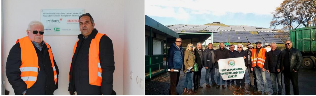
Güneş Enerjisi Üretim Panelleri-Freiburg-Almanya

13-16.Kasım.2017 tarihleri arasında Birliğimizin de proje ortağı bulunduğu, aynı zamanda Birleşmiş Milletler Kalkınma Programı çerçevesinde Küresel Çevre Fonu tarafından da desteklenmekte olan 'BİRLİKTE YEŞİL ENERJİYE' projesi kapsamında, incelemelerde bulunmak üzere bir yurt dışı gezisi düzenlenmiştir.