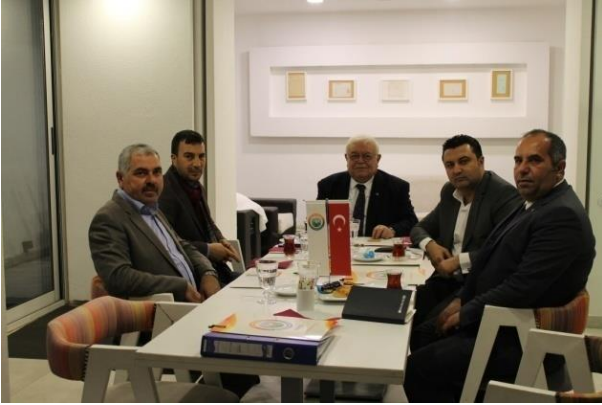
Encümen Toplantımız 19.01.2018-Burhaniye