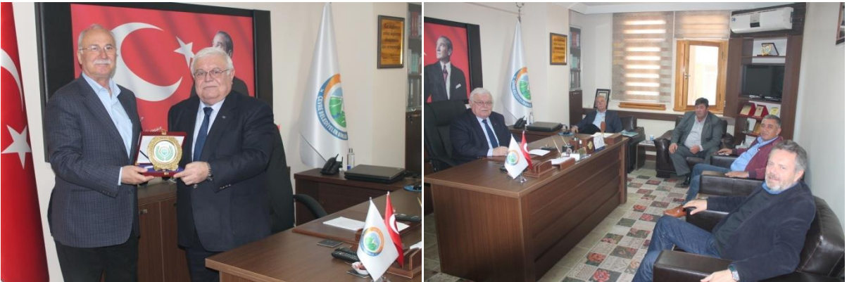
Kurucu Birlik Bşk.mız ve Ö.Dönem Bld.Bşk.larımızın Birliğimizi ziyareti 20.03.2017