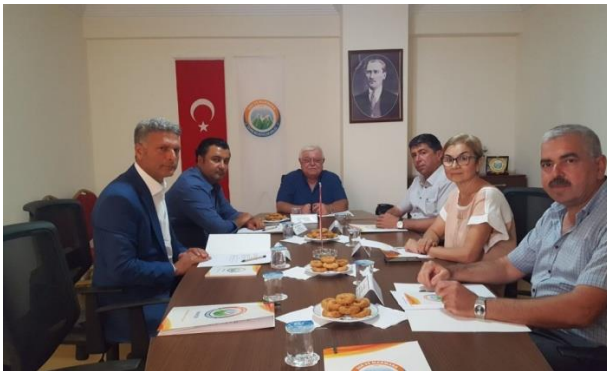
Encümen Toplantımız 12.07.2017-Edremit