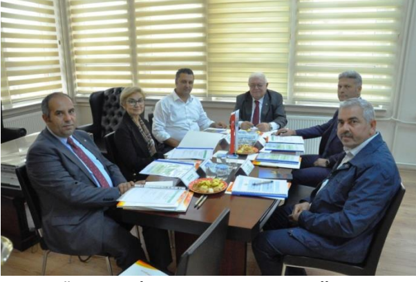
Encümen Toplantımız 19.10.2017-Malkara