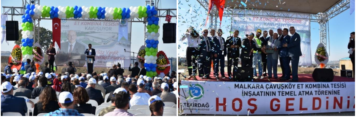
Malkara Et Kombina Tesisi Açılış Töreni 20.10.2017