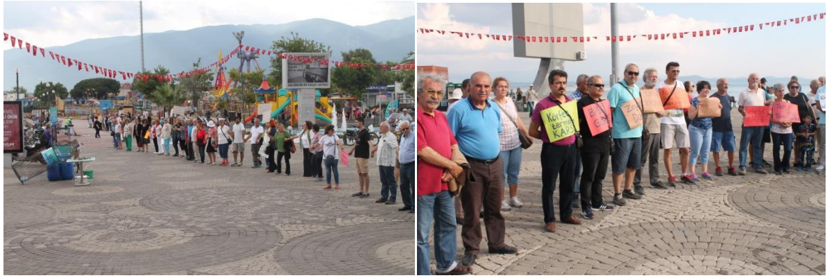
Akçay Çevre Etkinliği