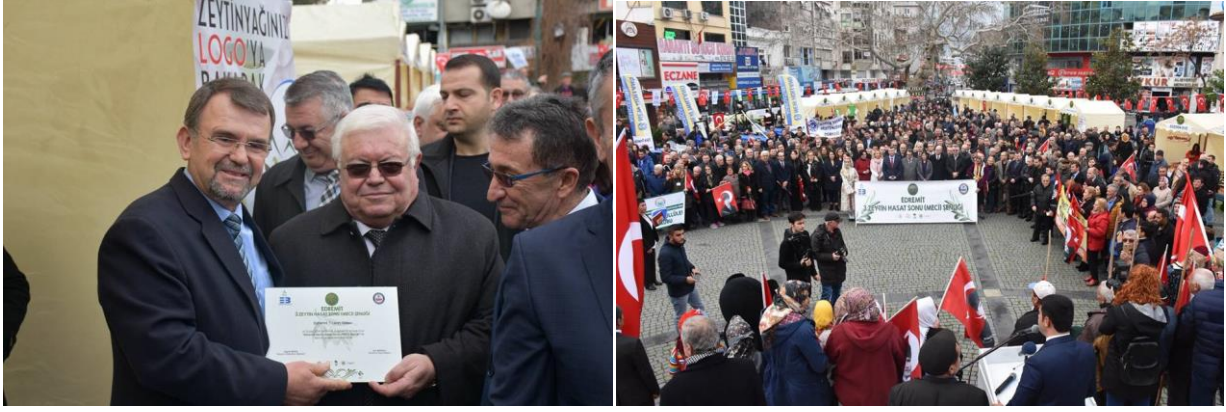
Edremit Zeytin Hasat Sonu Etkinliği 14.02.2018