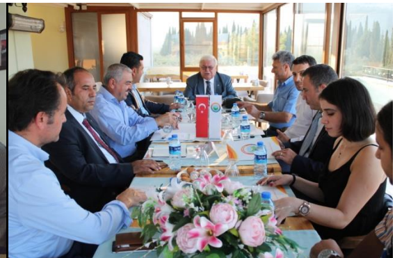
Encümen Toplantımız 27.09.2017-Kızılköprü-Edr.