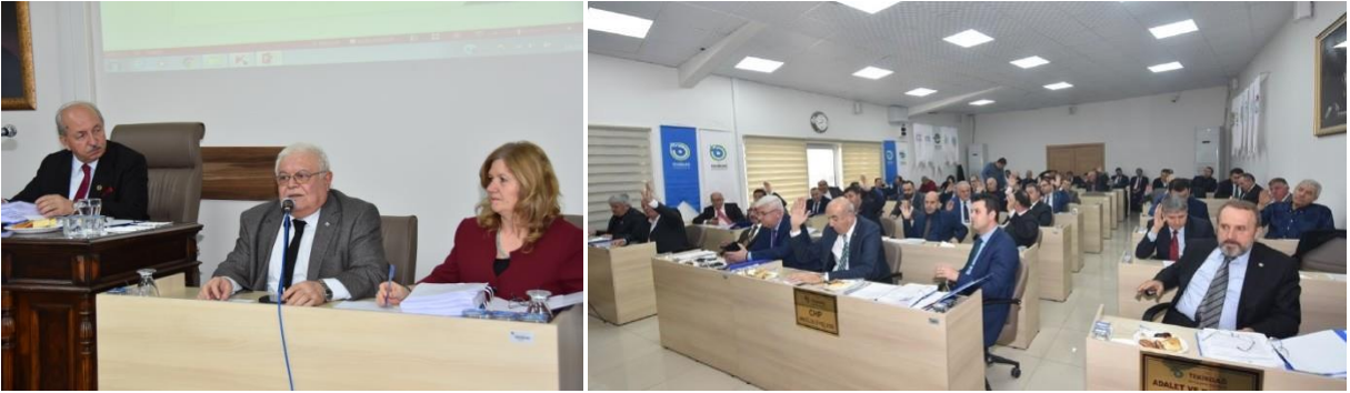
Tekirdağ Büyükşehir Belediye Meclis Toplantısı 14.03.2018