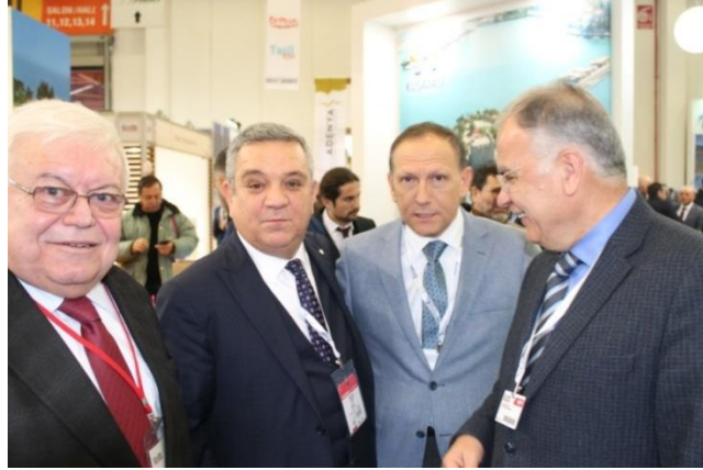
Kuşadası ve Selçuk Belediye Başkanları ile birlikte