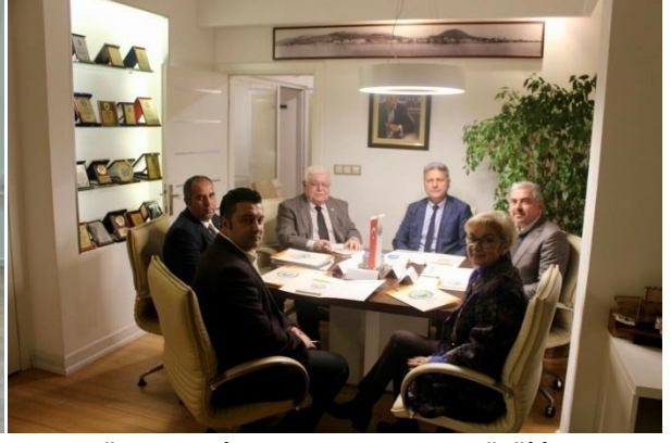
Encümen Toplantımız 22.12.2017-Küçükkuyu