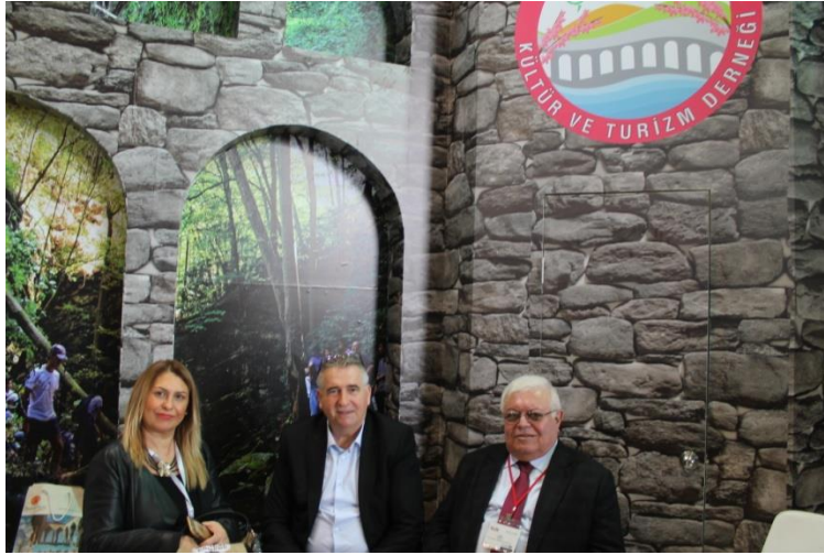
Çatalca Belediye Başkanı ile birlikte