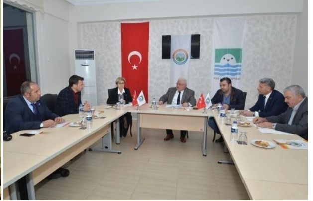
Encümen Toplantımız 02.03.2018-Foça