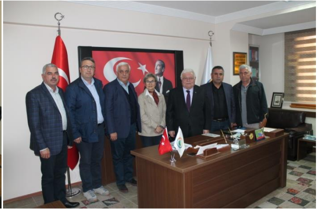
Encümen Toplantımız 25.04.2017-Edremit