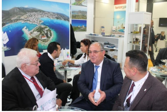
Datça Belediye Başkanı ile birlikte