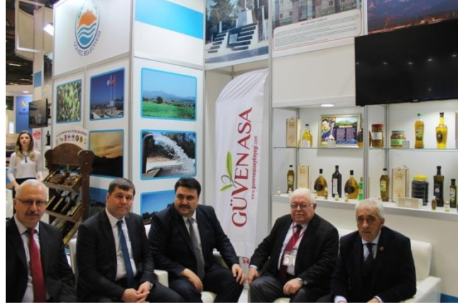
Gömeç ve Havran Belediye Başkanları ile birlikte