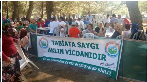
Yayla Şenliği-Kaz Dağları