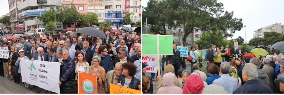
Zeytin yasa tasarısı ile ilgili basın açıklaması-Burhaniye