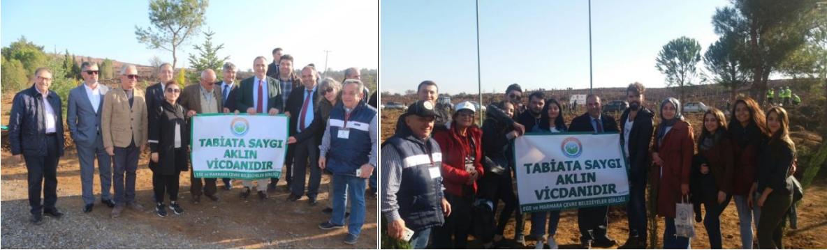
Çam Fidanı dikim etkinliği-Ayvalık