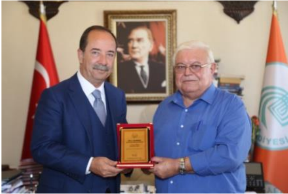
Edirne B.B. Sn. Recep GÜRKAN

15.09.2018 tarihinde serhat kentimiz Edirne Belediye Başkanı Sn: Recep GÜRKAN'ı makamında ziyaret ederek çevre konusundaki başarılı çalışmalarını nedeniyle kendisini kutladık ve başarılarının devamını diledik. Aynı gün Edirne Uzunköprü-Kırcasalih Belediye Başkanı Sn: Suat KARAKAŞ'ı da makamında ziyaret ederek başarılar diledik.