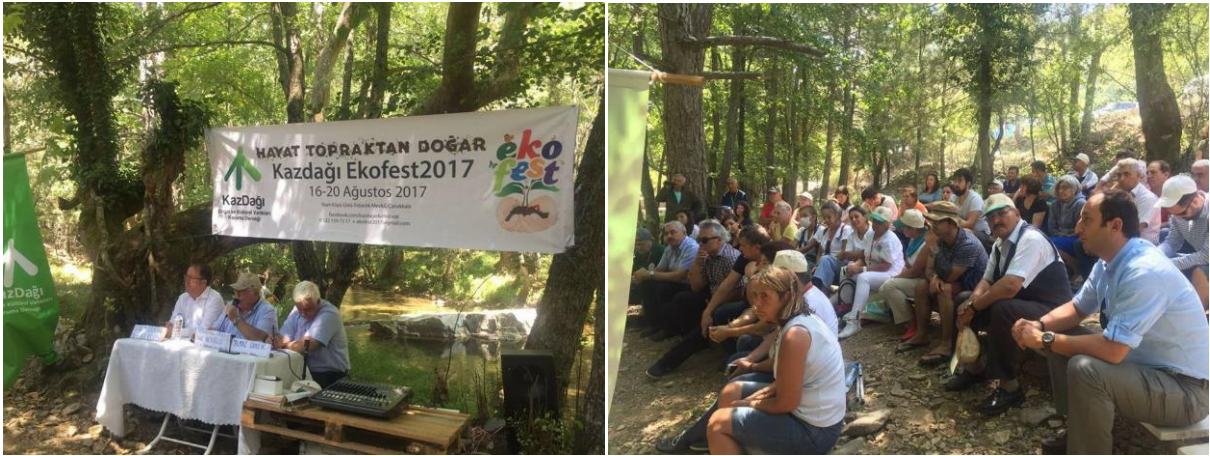
Yerel Yönetimler ve Toprak konulu panel-Kaz Dağları

Bu yıl da, Kaz dağı doğal ve kültürel varlıkları koruma Derneği tarafından Birliğimiz ve Edremit- Küçükkuyu Belediyelerimizin destekleri ile 'Hayat Topraktan Doğar' sloganı ile düzenlenen eko festival, binlerce kişinin katılımı ile gerçekleşti.