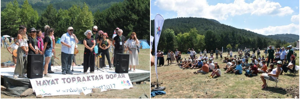
Ekofest festival açılışı-Kaz Dağları-Edremit

Bu yıl da, Kaz dağı doğal ve kültürel varlıkları koruma Derneği tarafından Birliğimiz ve Edremit- Küçükkuyu Belediyelerimizin destekleri ile 'Hayat Topraktan Doğar' sloganı ile düzenlenen eko festival, binlerce kişinin katılımı ile gerçekleşti.