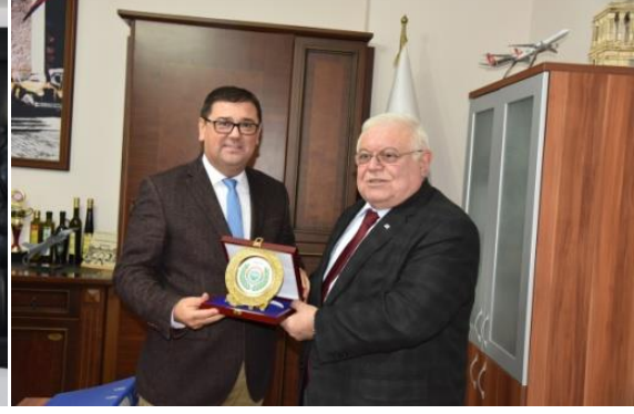
Milas B.B. 18.01.2017