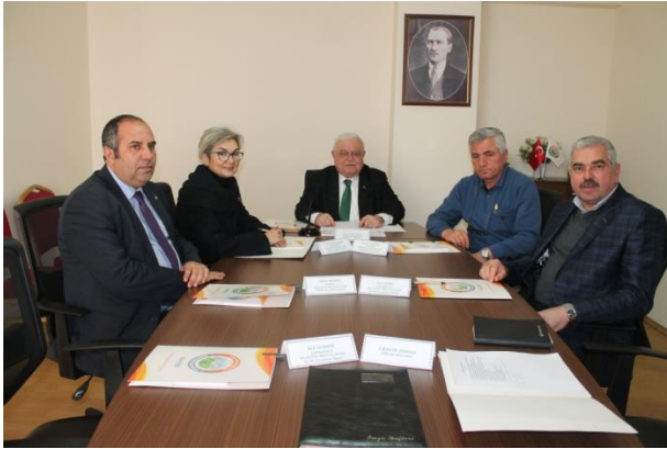
Encümen Toplantımız 15.02.2017-Edremit

Birliğimizin Encümen Toplantıları Tüzüğüümüz uyarınca her ay düzenli olarak gerçekleştirilmiş, meclis kararlarımız ve çalışma programımız doğrultusunda kararlar alınmıştır. Encümen Toplantılarımız sadece birlik merkezimizde değil, mümkün olduğunca değişik üye belediyelerimizin sınırları içinde yapılmaya özen gösterilmiş bu vesile ile Encümen Üyelerimiz ile birlikte, konuk olduğumuz üye Belediye Başkanlarımızı makamlarında ziyaret ve görüşme olanağı bulunmuştur.