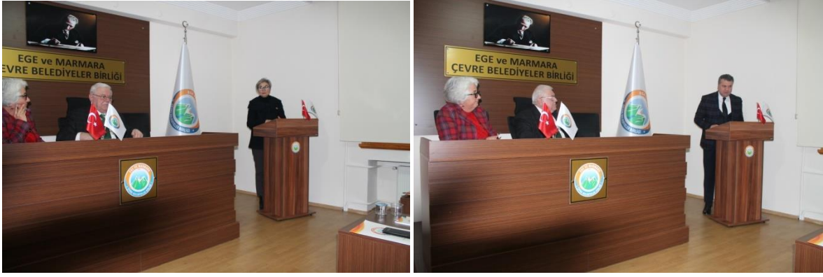
Proje değerlendirme ve Çalıştay hazırlık toplantısı-Birlik Toplantı Salonu