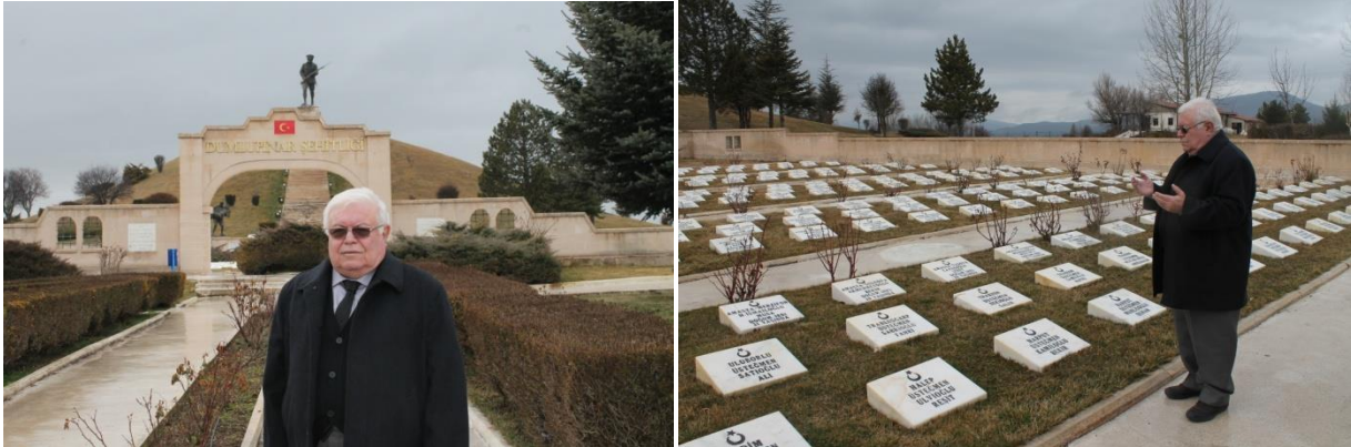
Dumlupınar Şehitliği 22.02.2018-Kütahya

22.02.2018 tarihinde Büyük Önder M.Kemal ATATÜRK'ün Başkomutanlığında, 30 Ağustos 1922 de Dumlupınar'da büyük zaferle sonuçlanarak tarihin akışını değiştiren ve Türkiye Cumhuriyetinin kuruluşunun temellerinin atıldığı Başkomutanlık meydan muharebesinde ve tüm cephelerde şehit düşen vatan evlatlarımız anısına düzenlenen DUMLUPINAR ŞEHİTLİĞİMİZİ ziyaret ettik.