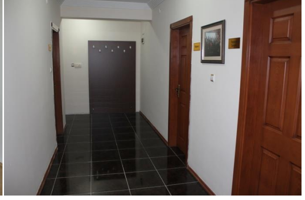
Birlik Encümeni Toplantı Salonu 14.02.2017