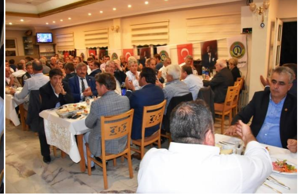
Muhtarlar yemekli Toplantısı – Malkara