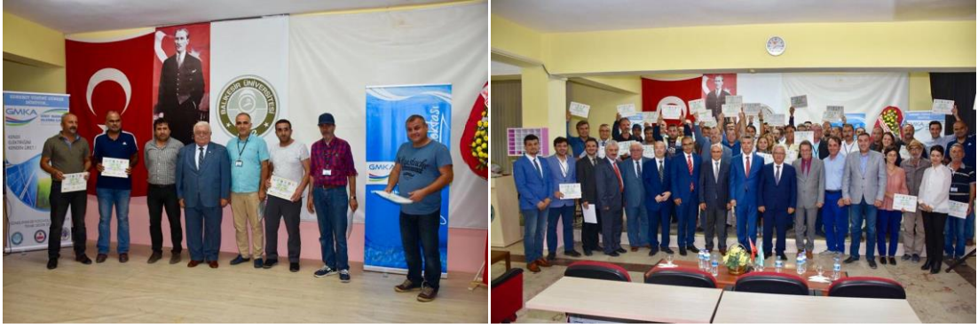
Edremit Meslek Yüksek Okulu-Eğitim sonu Sertifika Töreni