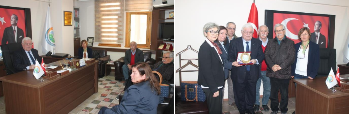
Burhaniye Çevre Platformunun Birliğimizi ziyareti 20.03.2017

ziyaret ettiler. Burhaniye çevre sorunları ve Birlik çalışmaları hakkında karşılıklı bilgi ve görüş paylaşımında bulunulan bu görüşmede, platform temsilcilerine, platformun yapacağı çevre etkinliklerinde Birlik olarak her türlü destek verileceğini beyan ettik ve Burhaniye Çevre Platformuna çalışmalarında başarılar diledik.