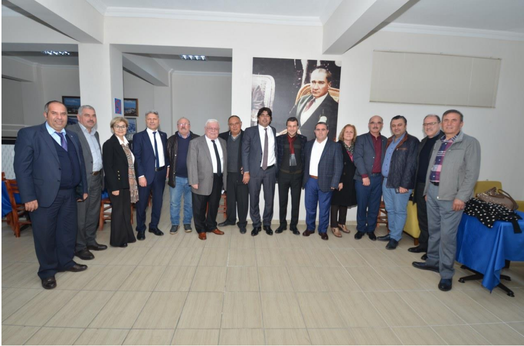
Foça Belediye Başkanı-Foça Belediye Meclis Üyeleri ve Birlik Encümen Üyelerimiz 02.03.2018