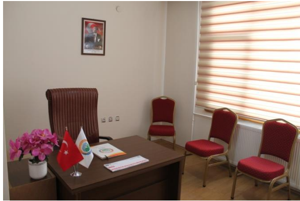
Birlik Çok Amaçlı Toplantı Salonu ve Çalışma Ofisi 14.02.2017