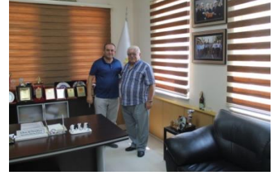
Hayrabolu Bld.Başkan.Yardımcısı 29.07.2016