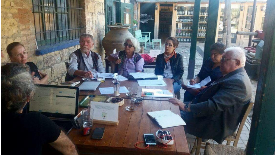
GEF-SGM Proje Değerlendirme Toplantısı Küçükkuşu 07.10.2016

İda Dayanışma Derneği, Ayvalık Tabiat Derneği, Ayvalık ARGE Derneği, Yeşil Düşünce Derneği, Buğday Derneği, Genç Troya Derneği gibi sivil toplum kuruluşlarının da destekleyeceği bu projenin Çalışma alanı Kazdağları ve Edremit Körfezi olarak belirlenirken, proje dönemi 1.Kasım.2016-1.Kasım.2017 tarihlerini kapsıyor.