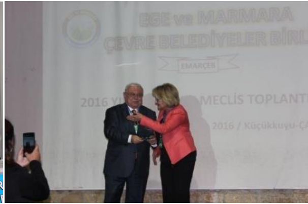
Denizli-Bozkurt Belediye Başkanı Sn. Birsen ÇELİK