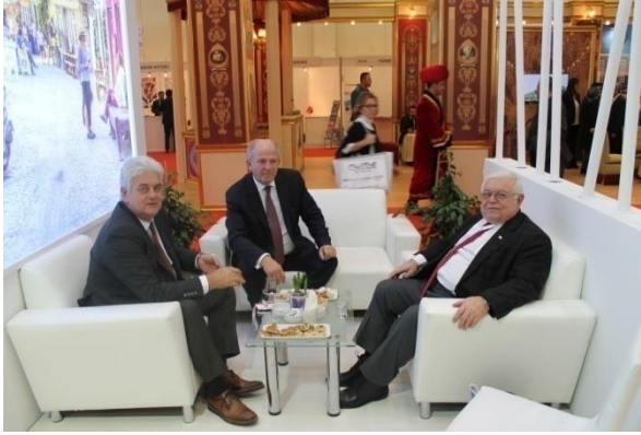
Çeşme Belediyesi Tanıtım Standı