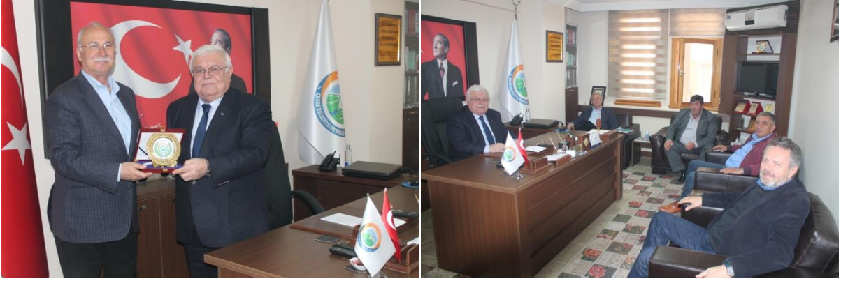
Kurucu Birlik Bşk.mız ve Ö.Dönem Bld.Bşk.larımızın Birliğimizi ziyareti 20.03.2017