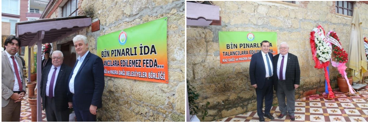
Küçükkuşu Zeytin Hasat Şenliğinde Foça-Çeşme ve Narlıdere Bld.Bşk.ları ile beraber 12.02.2016