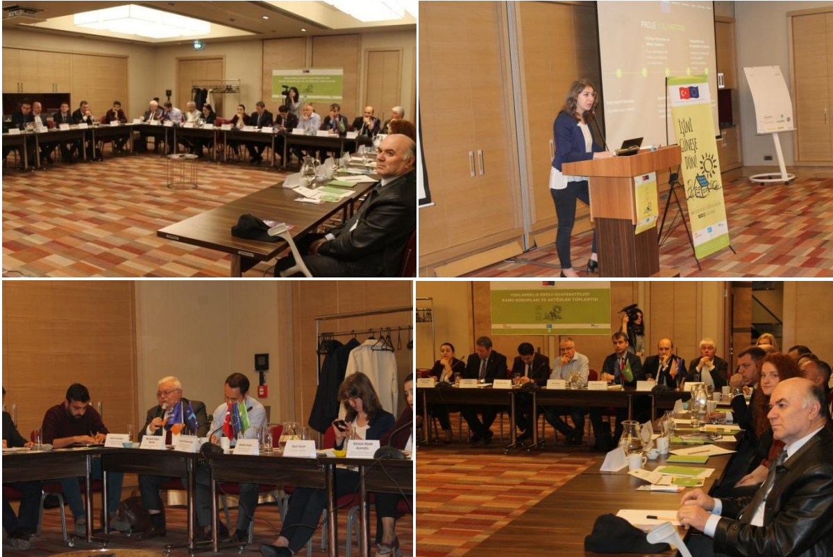
Yenilenebilir Enerji Kooperatifleri Kamu Kurumları ve Aktörler Toplantısı-Ankara

Enerji kooperatifçiliği konusunda uygulamada karşılaşılan sorunlar ve çözüm yollarının masaya yatırıldığı bu toplantıda birliğimiz adına söz alarak yenilenebilir enerji üretim tesisleri konusunda bir çok başarılı projenin yerel yönetimler tarafından yaşama geçirildiğini bu konuda yerel yönetimlerimizin yeterli deneyim ve donanıma sahip olduğunu belirttik ve yenilenebilir enerji kooperatiflerinin kurulması ve bu kooperatiflere işlerlik kazandırılmasında belediyelerimizin öncülük edebileceği görüşümüzü ifade ettik.