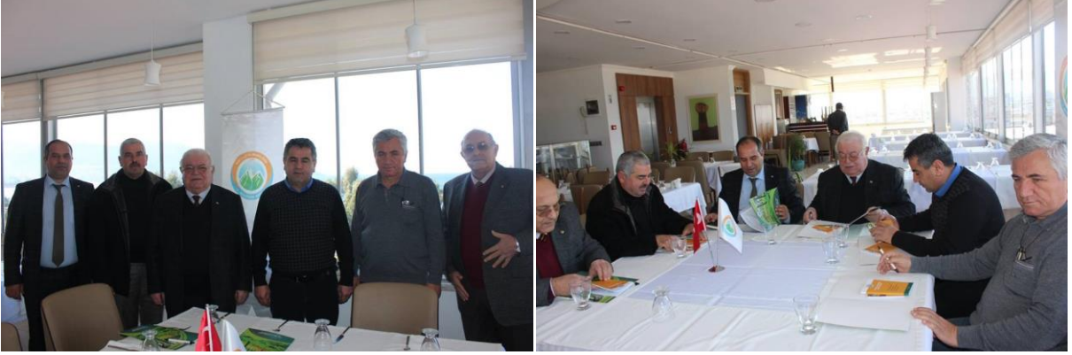
Ocak 2016 ayı Birlik Encümen Toplantımız 22.01.2016- DİKİLİ AGZ Otel

21.01.2016 tarihinde 2016 yılının ilk Encümen Toplantımızı Dikili de yaparak yeni yıla ait projelerimizi ve çalışma programımızı gözden geçirdik.