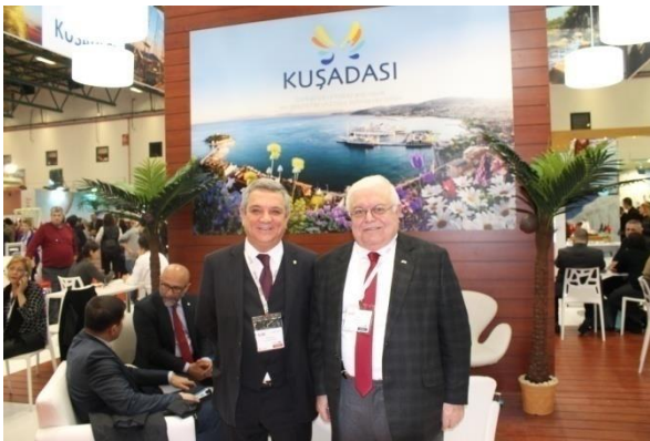
Kuşadası Belediyesi Tanıtım Standı