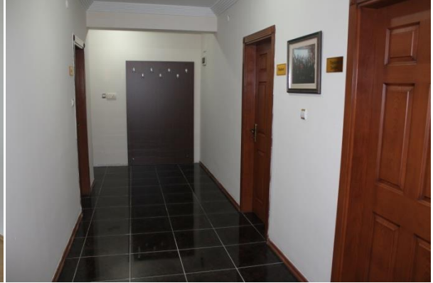
Birlik Encümeni Toplantı Salonu