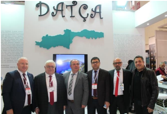
Datça Belediyesi Tanıtım Standı