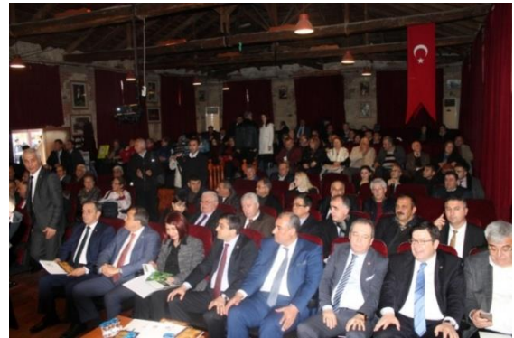
K.Kuyu Belediyesi Tehdit Altındaki Zeytin Paneli 12.02.2016-Küçükkuyu