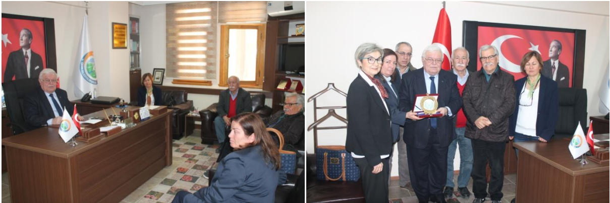
Burhaniye Çevre Platformunun Birliğimizi ziyareti 20.03.2017