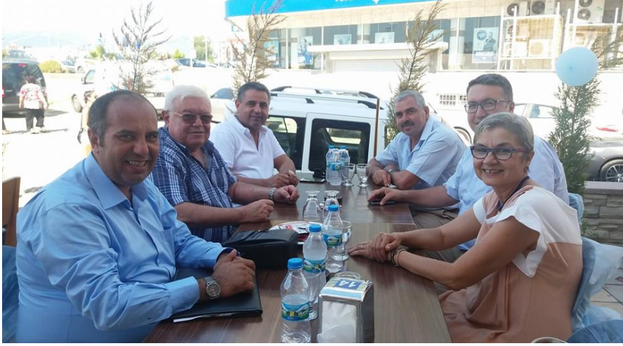
Encümen Toplantımız 14.07.2016-Akçay