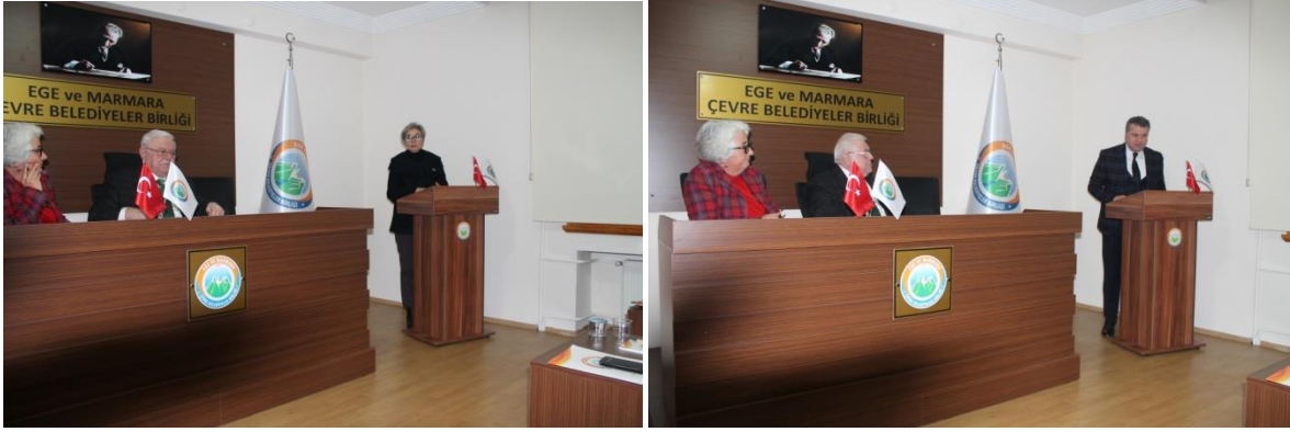
Proje değerlendirme ve Çalıştay hazırlık toplantısı-Birlik Toplantı Salonu