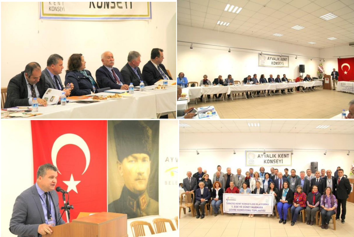
Türkiye Kent Konseyleri Platformu Toplantısı-Ayvalık

01.04.2017 tarihinde Ayvalık Kent Konseyi ev sahipliğinde düzenlenen Türkiye Kent Konseyleri Platformu Güney Marmara ve Ege Çevre Komisyonu toplantısına konuşmacı olarak katılarak çevre sorunları konusunda bir sunumda bulunduk ve bu toplantıda birliğimizin proje ve çalışmaları hakkında katılımcıları bilgilendirdik.