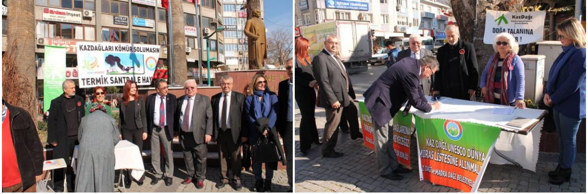
Yenice-Çırpılarda yapılması planlanan Termik Santrale karşı imza Kampanyası 03.02.2016-EDREMIT