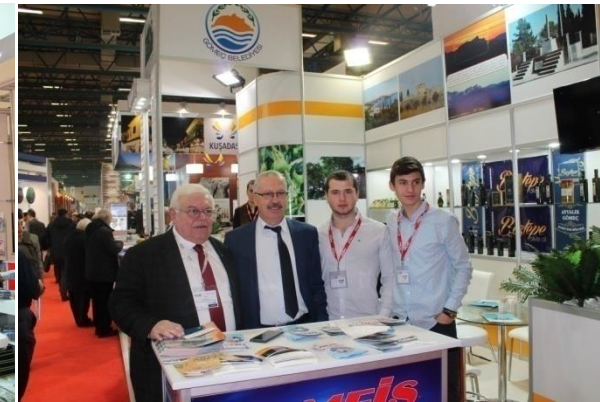
Gömeç Belediyesi Tanıtım Standı