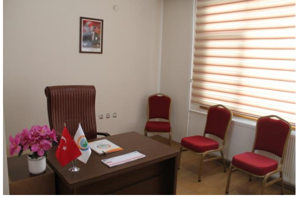
Birlik Çok Amaçlı Toplantı Salonu ve Çalışma Ofisi