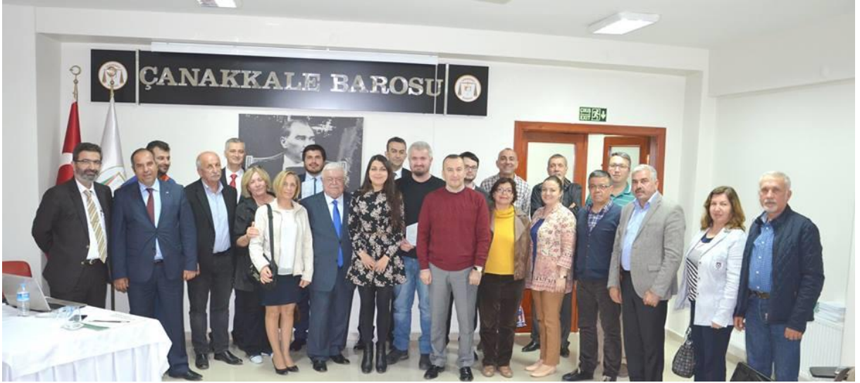
Çanakkale Barosu Toplantı Salonu-07.04.2016

Programda; Çanakkale Barosu Çevre ve Kent Hukuku Komisyonu'nun 2000 yılında Çan 18 Mart Termik Santraline karşı başlatmış olduğu hukuk ve ekoloji mücadelesinde günümüze kadar gelinen süreçte açılmış 43 dava hakkında bilgilendirme yapılarak, Kaz Dağları için verilen hukuk ve ekoloji mücadelesinin Cerattepe ve tüm Türkiye'deki mücadelelerden ayrı tutulamayacağı vurgulandı.