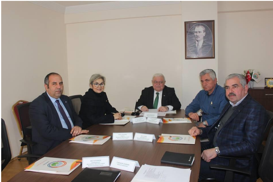
Encümen Toplantımız 15.02.2017-Edremit