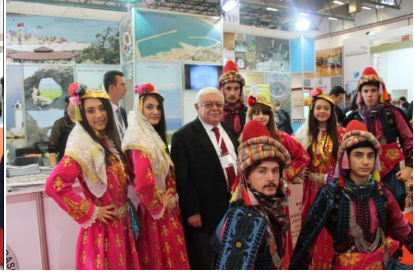
Burhaniye Belediyesi Tanıtım Standı