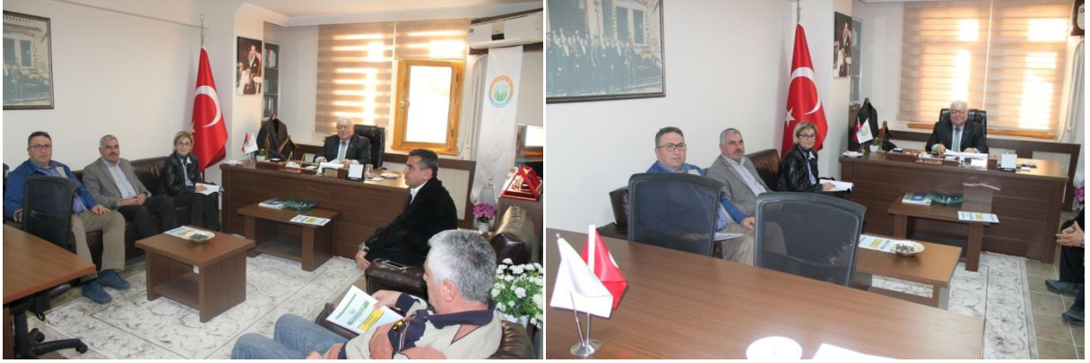
Şubat 2016 ayı Birlik Encümen Toplantımız 15.02.2016 -Edremit