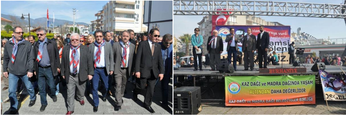
Körfez Karadenizliler Derneği Geleneksel 8.Hamsi Şenlikleri 28.02.2016-Akçay