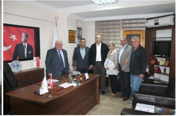
Encümen Toplantımız 27.10.2016-Edremit