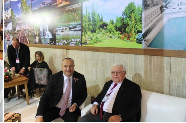
Çınarcık Belediyesi Tanıtım Standı