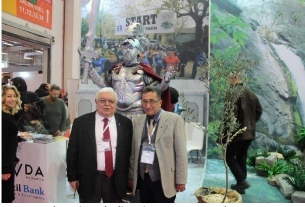
Edremit Belediyesi Tanıtım Standı