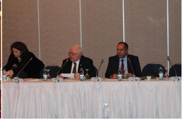
(IUCN) Dünya Doğayı Koruma Birliği Türkiye Ulusal Komitesi Toplantısı 27.01.2016-ANKARA