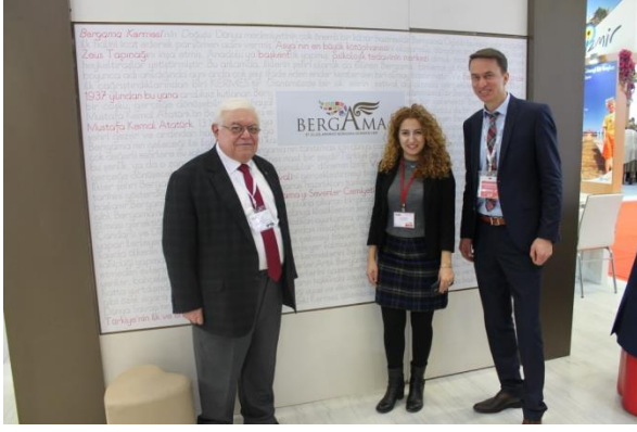
Bergama Belediyesi Tanıtım Standı