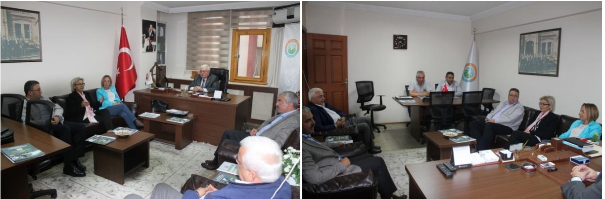
Encümen Toplantısı 20.04.2016-Edremit