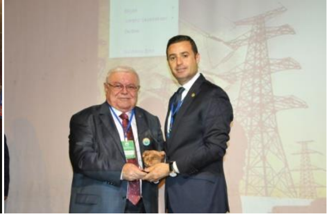
Balıkesir Milletvekili ve Enerji Projeleri Uzmanı Sn:Ahmet AKIN