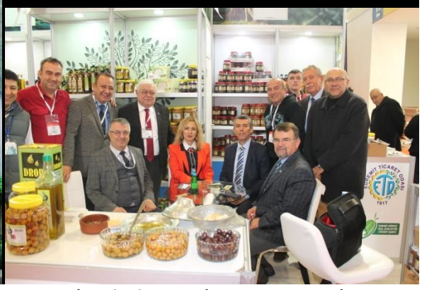
Edremit Ticaret Odası Tanıtım Standı