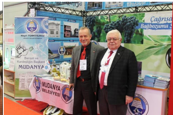
Mudanya Belediyesi Tanıtım Standı