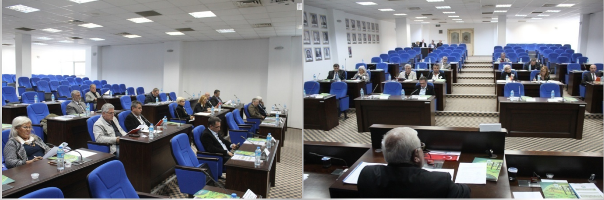
Birlik Olağan Meclis Toplantımız 07.11.2015