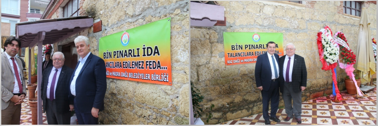
Küçükkuuyu Zeytin Hasat Şenliğinde Foça-Çeşme ve Narlıdere Bld.Bşk.ları ile beraber 12.02.2016