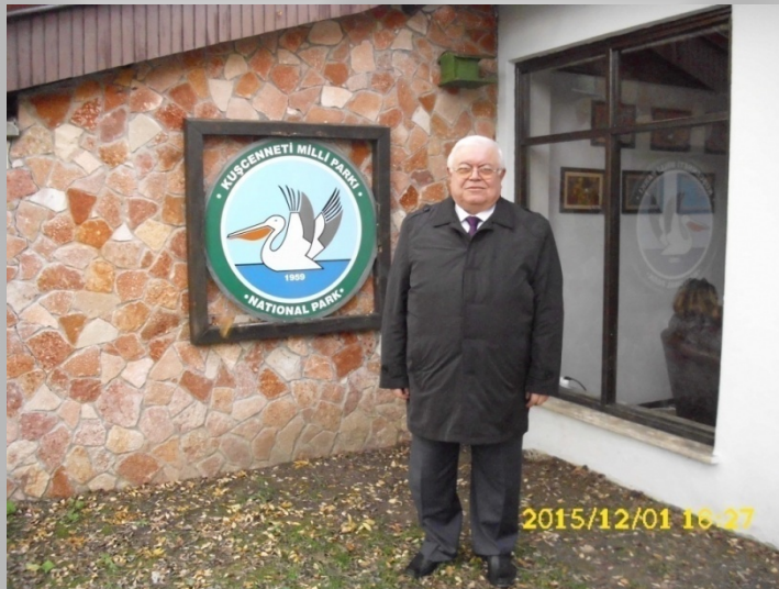
Birlik Başkanlığı olarak Bandırma-Manyas Kuş Cennetinde incelemelerde bulunduk.01.12.2015