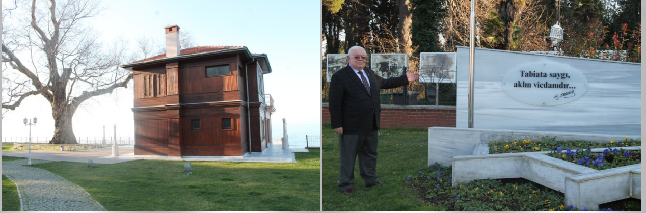
Atattürk'ün Yürüyen Köşkü 22.02.2016-Yalova

• 22.02.2016 tarihinde Yalova da Atatürk'ün Yürüyen Köşkü ziyaret edilerek günümüzdeki doğa katliamlarına inat- Atamızın talimatı ile tek bir ağaca zarar gelmemesi için köşkün kızaklarla 4.80 mt. yürütülüp kaydırılmış halini yerinde büyük bir ibretle gözlemledik