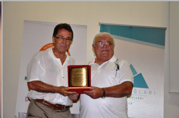
Kaz Dağları Çevre Ödülleri Töreni-29.08.2015-Adrına Otel-GÜRE