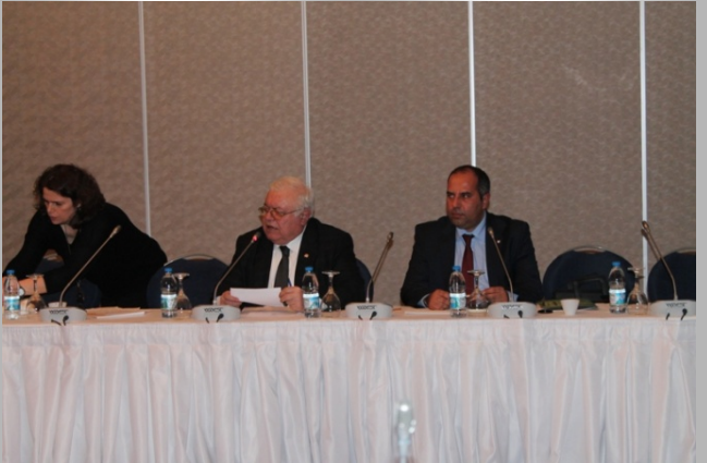
(IUCN) Dünya Doğayı Koruma Birliği Türkiye Ulusal Komitesi Toplantısı 27.01.2016-ANKARA