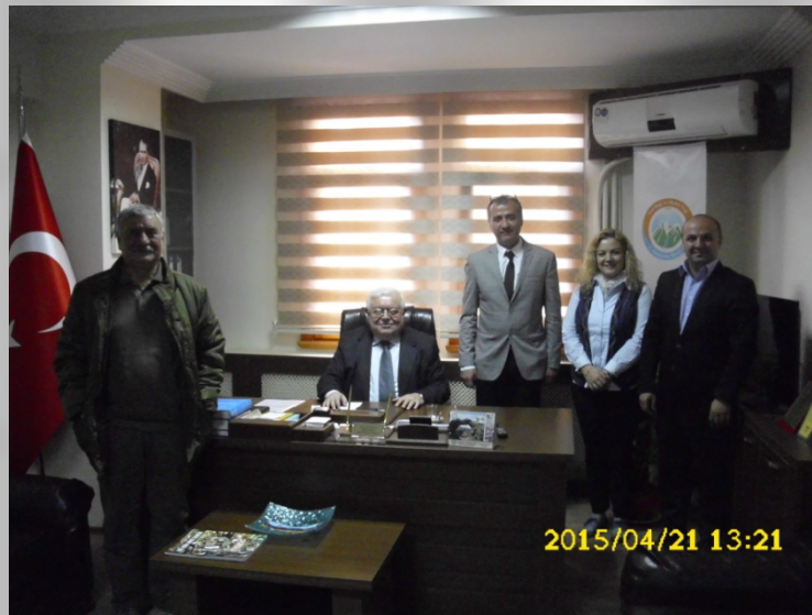
Ç.Kale Barosu Çevre Grubu Avukatları ile birlikte

Çevre ve Şehircilik Bakanlığı aleyhine açılmış bulunan bu davalardan bu güne kadar yürütmeyi durdurma ve iptal kararı olarak 18 tanesi kazanılmış 6 tanesi yeni açıldığı için halen devam etmektedir.