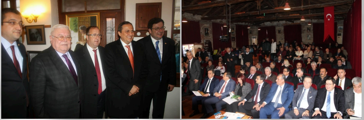
K.Kuyu Belediyesi Tehdit Altındaki Zeytin Paneli 12.02.2016-Küçükkuuyu