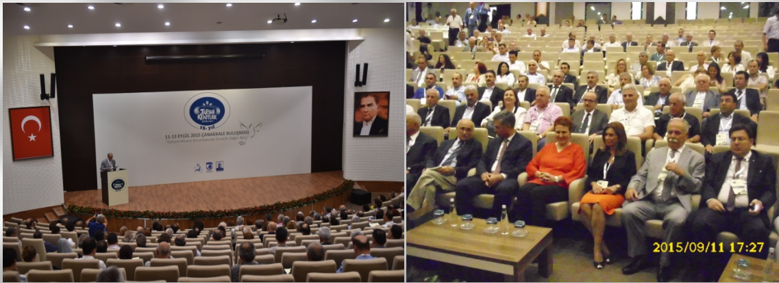
TKB nin Etkinlik Programı-11.09.2015 - Çanakkale