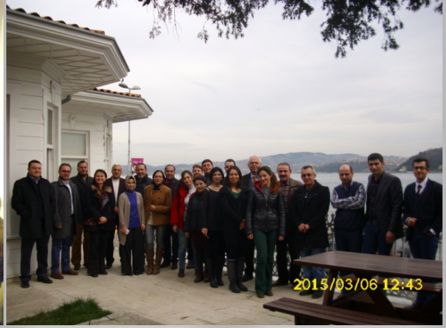
Birliğimiz Tarihi Kentler Birliği-Çekül Unesco Eğitim Seminerinde-İstanbul- 3-6.03.2015