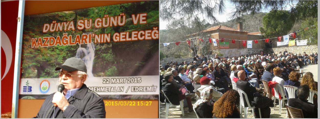
Dünya Su Günü ve Kaz Dağlarının Geleceği Etkinliği 22.03.2015-Mehmetalan-Edremit