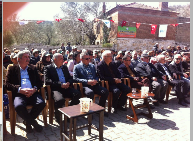
Dünya Su Günü ve Kaz Dağlarının Geleceği Paneli 22.03.2015 Mehmetalan Köyü-Edremit