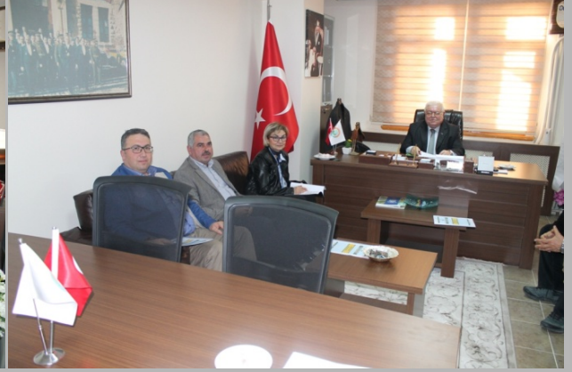
Şubat 2016 ayı Encümen toplantısı