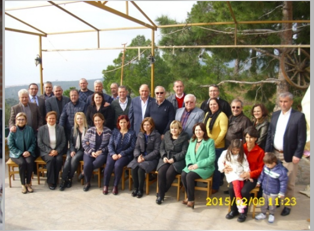
Belediye Başkanları toplantısı eşleri ile birlikte Kavlaklar Köyü 8.2.2015