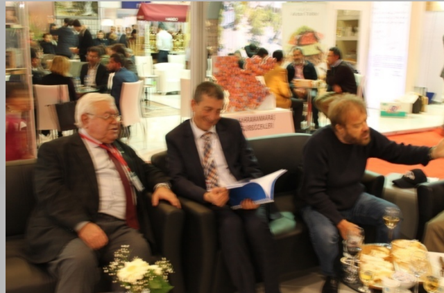
2016 EMİTT Turizm Fuarı Tekirdağ B.Şehir Bld.Bşk.Yard.ile birlikte 28.01.2016