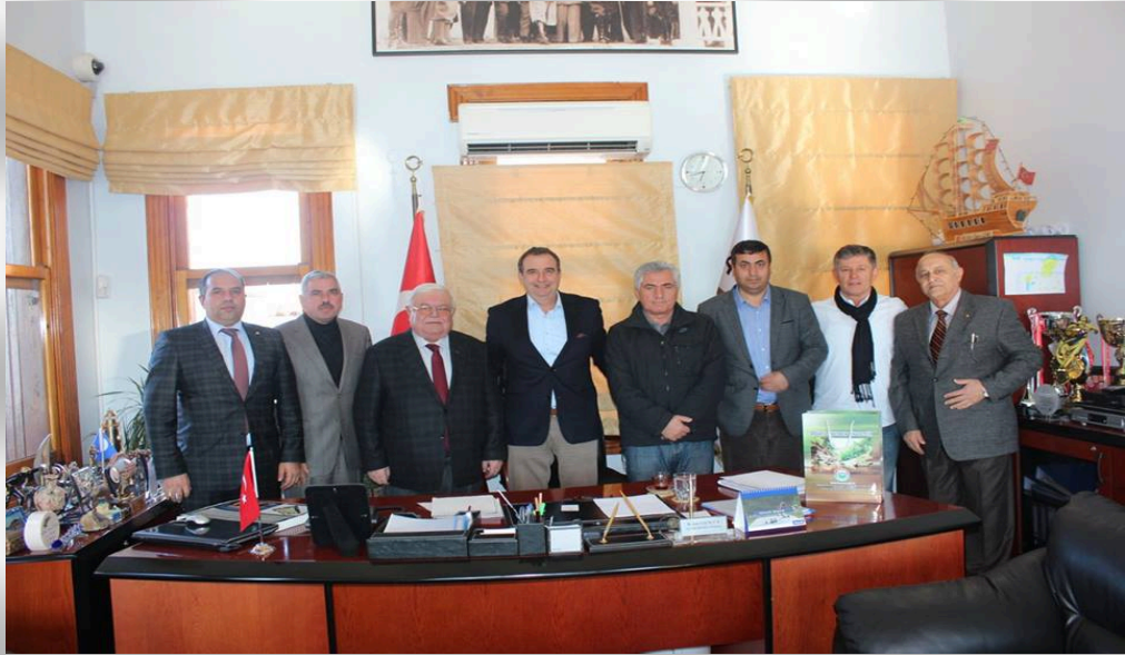
Birlik Encümen Üyelerimizle beraber Ayvalık Bld.Bşk. mızı ziyaret