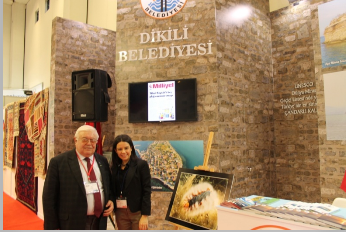
2016 EMİTT Turizm Fuarı Dikili Belediyesi Standı 28.01.2016