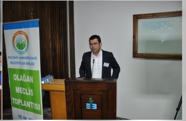
2015 yılı 1.Olağan Meclis Toplantısı 18.04.2015 Edremit Belediyesi Meclis Toplantı Salonu