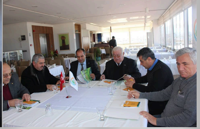
Ocak 2016 ayı Birlik Encümen Toplantımız 22.01.2016- DİKİLİ AGZ Otel