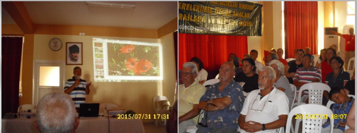
Kaz Dağlarında Tarım ve Sorunları Paneli 31.07.2015-Altınoluk