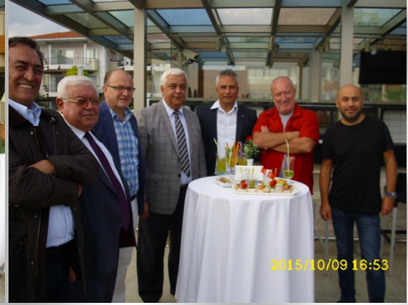
Ulusal Basın Mensupları Hoşgeldiniz Kokteyli -Venüs Termal Otel 9.10.2015-GÜRE