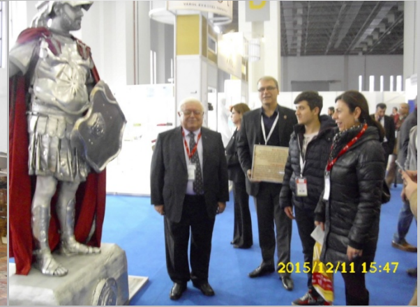
İzmir Travel Turkey Turizm Fuarında Edremit Belediyemizin Standını ziyaret ettik. 11.12.2015