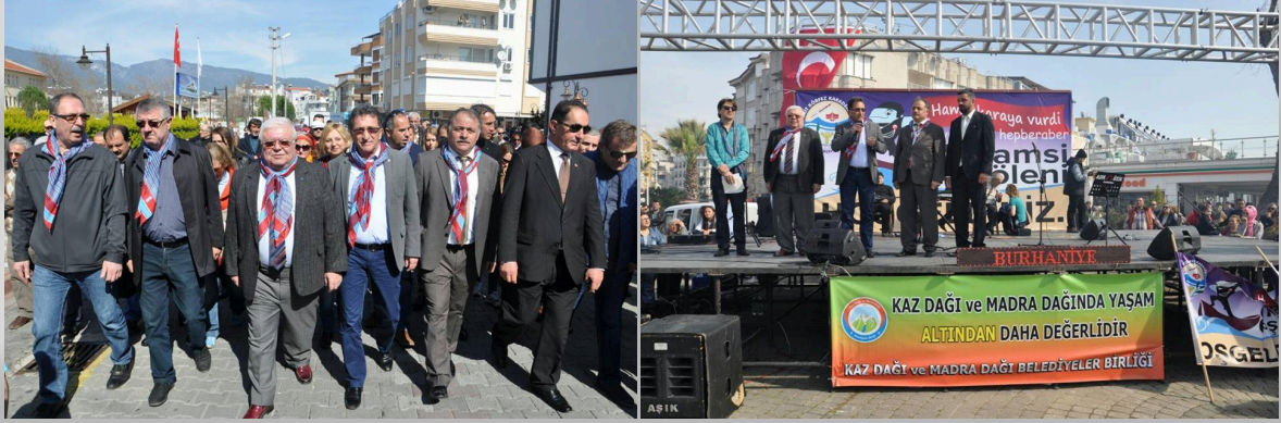
Körfez Karadenizliler Derneği Geleneksel 8.Hamsi Şenlikleri 28.02.2016-Akçay