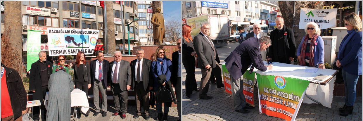
Yenice-Çırpılarda yapılması planlanan Termik Santrale karşı imza kampanyası 03.02.2016-EDREMIT

Kaz Dağlarımızın eteklerinde yerleşik Agonya bölgesindeki Ç.Kale Yenice İlçesine bağlı Çırpılar köyünde yapılması planlanan Termik Santralin bölgede bulunan altı adet gölete, Yenice-Gönen çayına, ekili alanlara, havaya ve suya dolayısı ile çevre ve canlı yaşam ve sağlığına vereceği zararlar nedeniyle başlatılan imza kampanyasında binlerce imza toplanarak ilgili makamlara intikal ettirilmiştir.