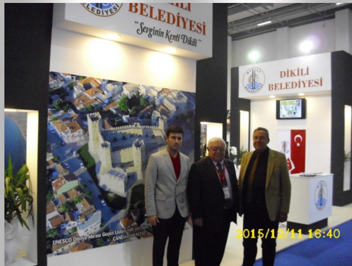
İzmir Travel Turkey Turizm Fuarında Dikili Belediyemizin Standını ziyaret ettik.11.12.2015