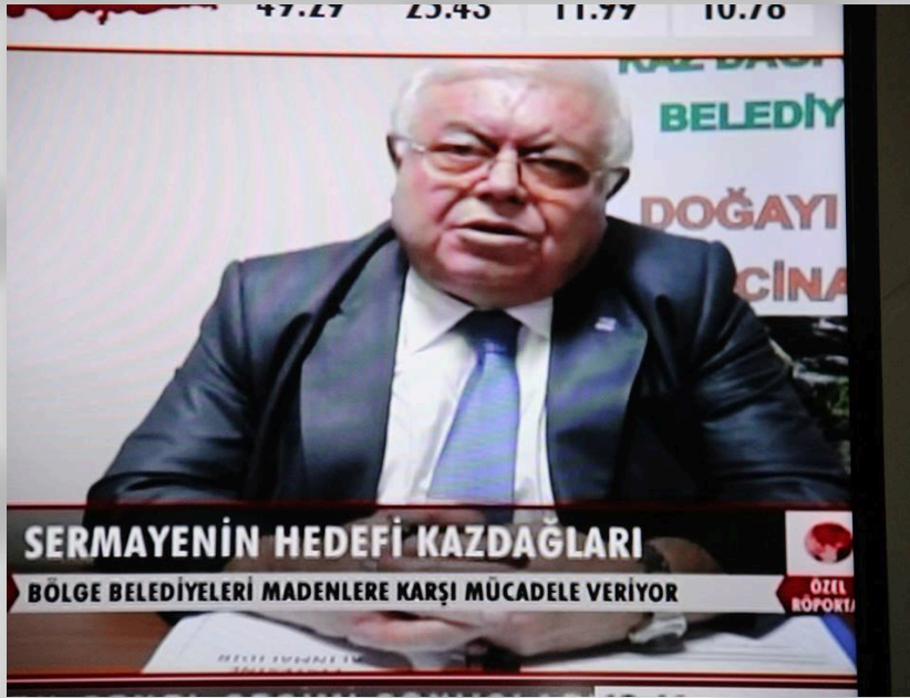
Hayat TV Kanalı-Röportajımız 02.11.2015-Edremit

• 02.11.2015 Tarihinde Hayat TV Televizyon kanalına verdiğimiz röportajda, Kaz Dağları ve Madra Dağında maden şirketlerinin yürüttüğü doğa katliamlarına karşı, Birlik olarak yaptığımız girişim ve çalışmaları anlattık.