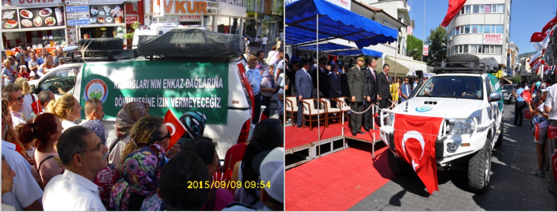
Edremit Kurtuluş Şenlikleri 09.09.2015-Edremit