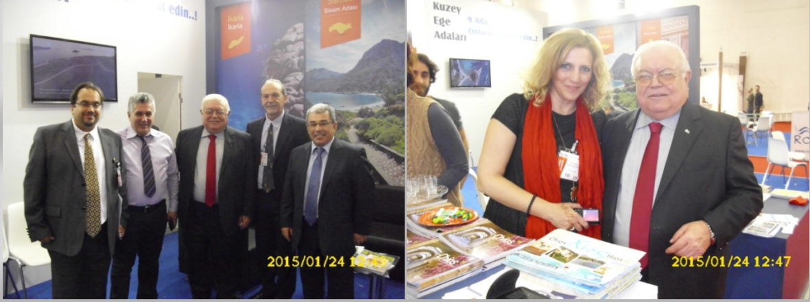
Uluslar arası EMİTT Turizm Fuarı Stant ziyaretlerimiz