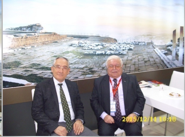
İzmir Travel Turkey Turizm Fuarında Bergama Belediyemizin Standını ziyaret ettik.11.12.2015